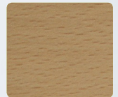
DEK Dekor, Buche hell pattern, light beech wood

Weitere Dekore auf Anfrage möglich. More patterns available on request.