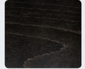
SCHW schwarz black