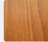
MBR mittelbraun regular brown